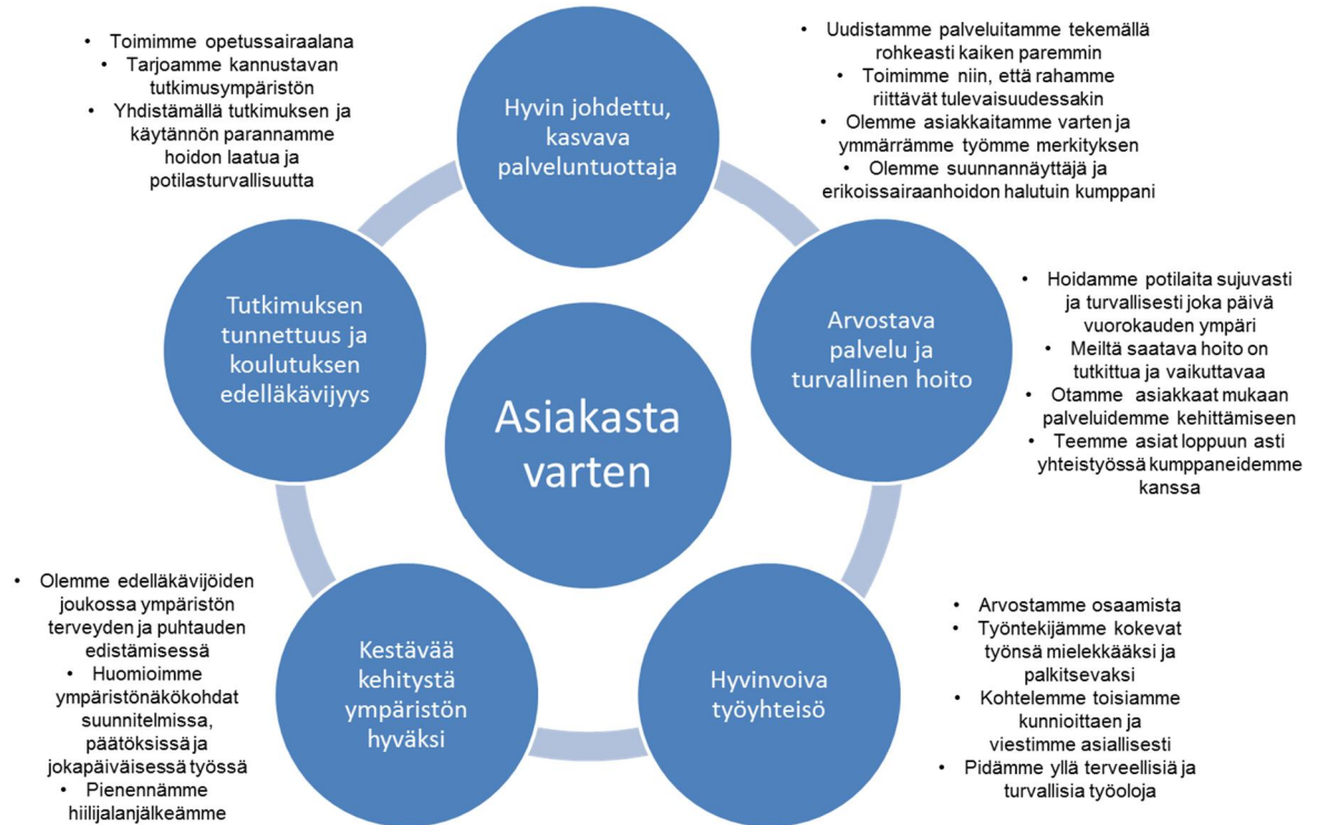
Kuva 1. Vastuullisuustavoitteet ja -lupaukset.